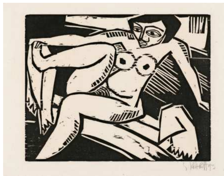
Karl Schmidt-Rottluff: Mädchen sich den Fuß trocknend, 1913, Holzschnitt auf Büttchen