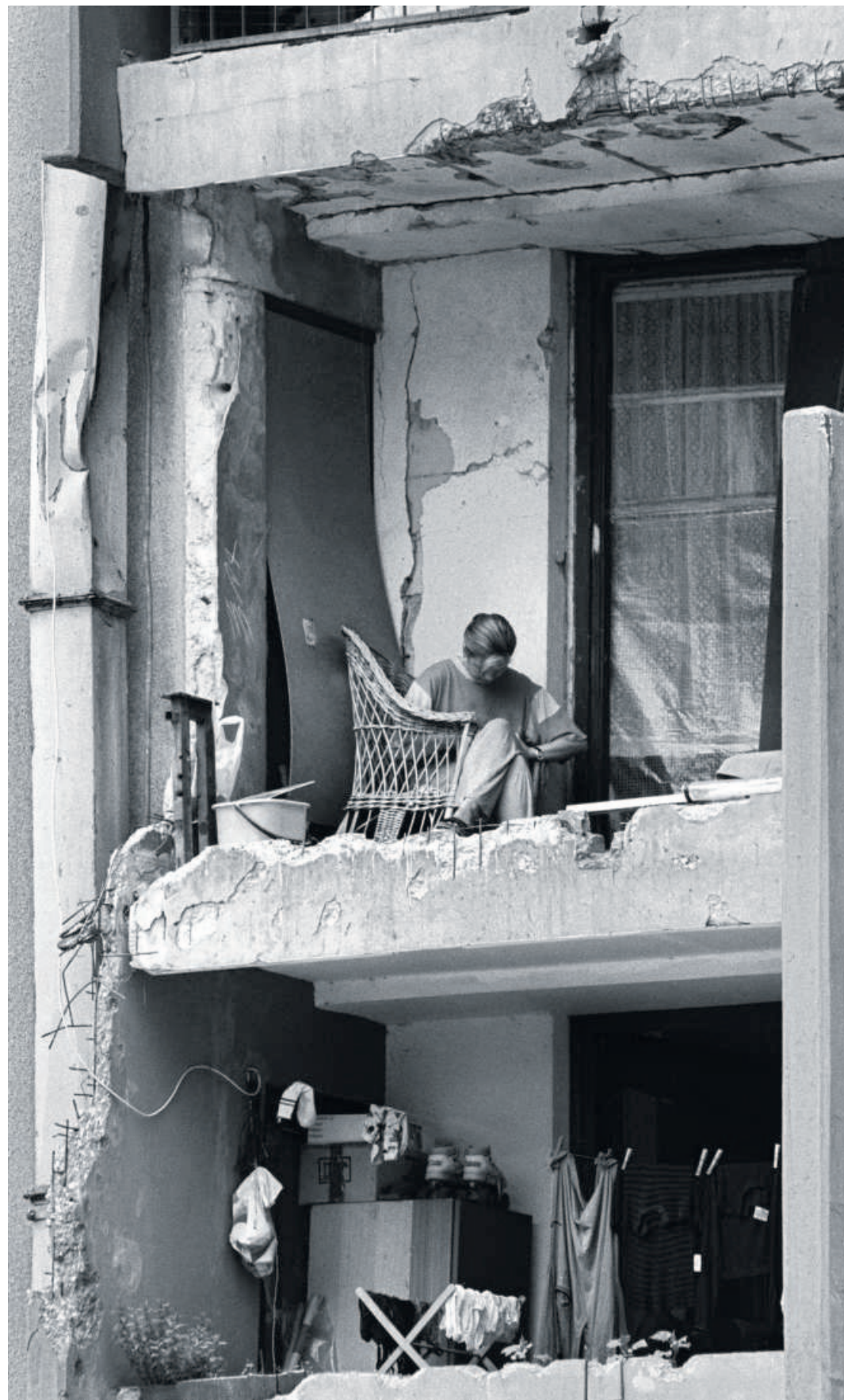
Anja Niedringhaus: Maniküre auf dem Balkon, Sarajevo, Bosnien, 3. Juli 1995 Foto Anja Niedringhaus/MMK